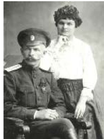
Будущий генерал Марков с женой, станция Урюпинская.

Наше поколение присягало Союзу Советских Социалистических Республик. Люди помоложе помнят нонсенс Присяги СНГ. Сейчас – РФ. Но никто из нас не присягал генсекам с президентами.