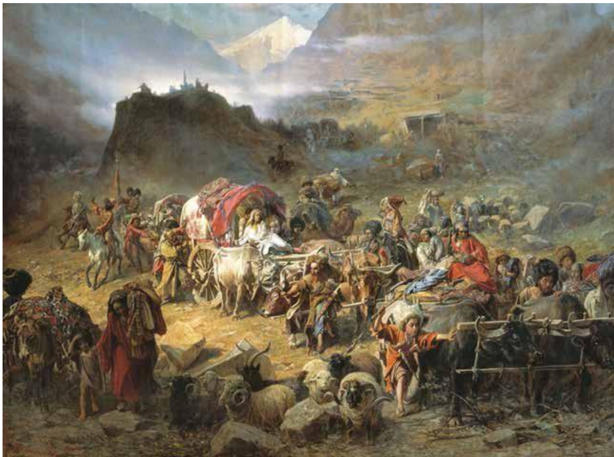
П.Н.Грузинский. Оставление горцами аула при приближении русских войск. Холст, масло, 1872